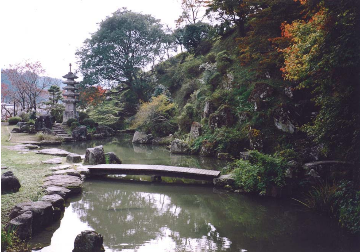
(大分県指定名勝 旧久留島氏庭園 附 清水御門前庭)