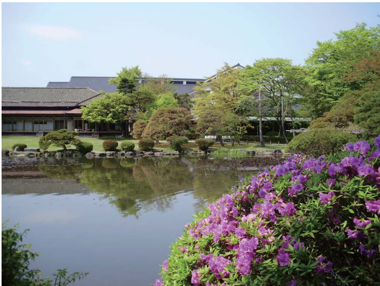
[旧南部家別邸庭園]